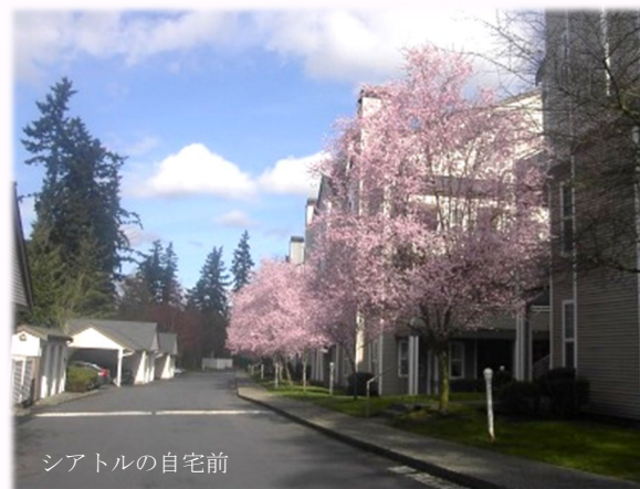
シアトルの自宅前