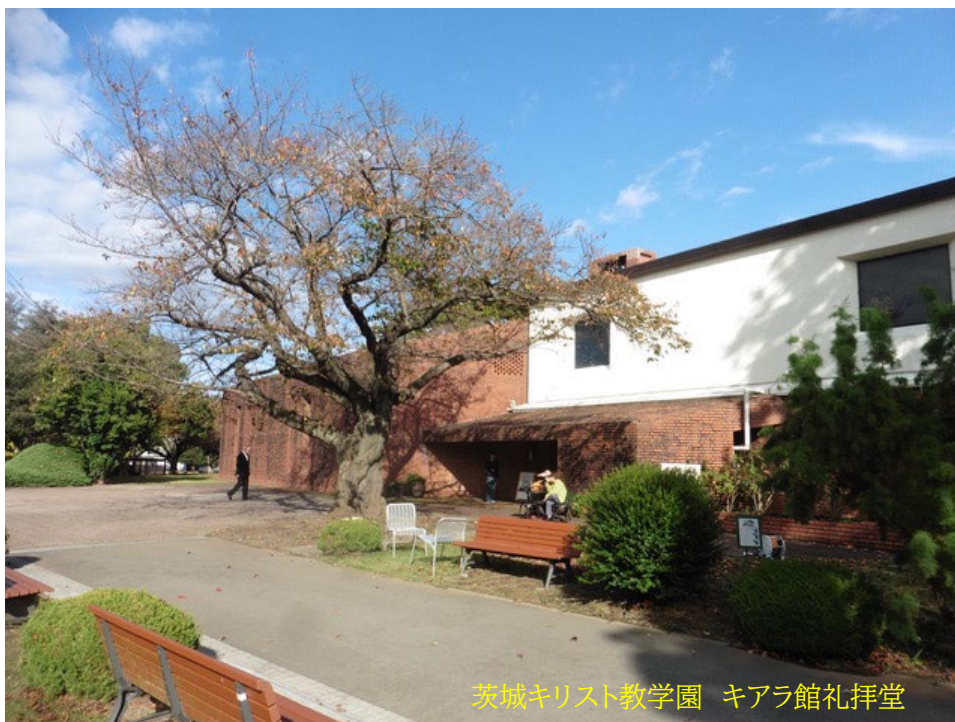
茨城キリスト教学園 キアラ館礼拝堂