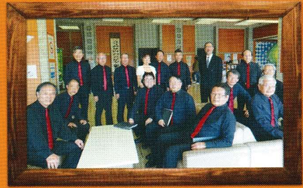
男声合唱団コール・グランツ