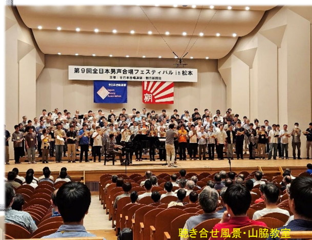
聴き合せ風景・山脇教室

・講習終了後、大ホールに全員が集まり、 3教室の成果発表が行われました。これは 翌2日目に行われる大ホールを使っ ての本番モードとなります。