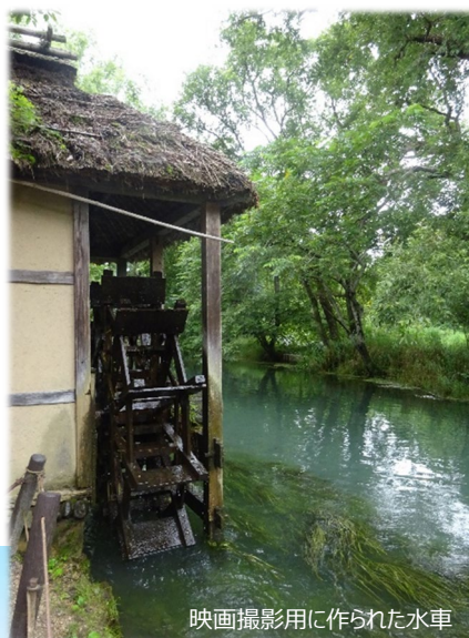
映画撮影用に作られた水車