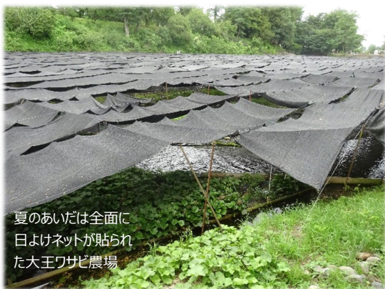
夏のあいだは全面に 日よけネットが貼られ た大王ワサビ農場