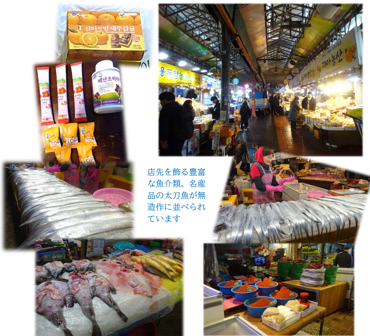
店先を飾る豊富な魚類。名産品の太刀魚が無造作に並べられています

濟州島には何カ所も伝統的な市場があり、いつも活気に溢れています。島の特産品や名物グルメ、おみやげ物まで揃っているため、旅行の必須コースにもなっています。