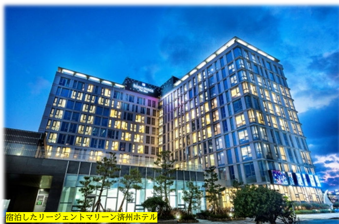
宿泊したリージェントマリーナ濟州ホテル

彩の国プラチナ特別編成合唱団一行が宿泊したリージェントマリーナ濟州ホテルは海辺に面した絶好のロケーションにもかかわらず、毎日無情の雨で海を楽しむことはできませんでした(-_-)