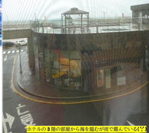
ホテルの3階の部屋から海を臨むが雨で霞んでいる(?)